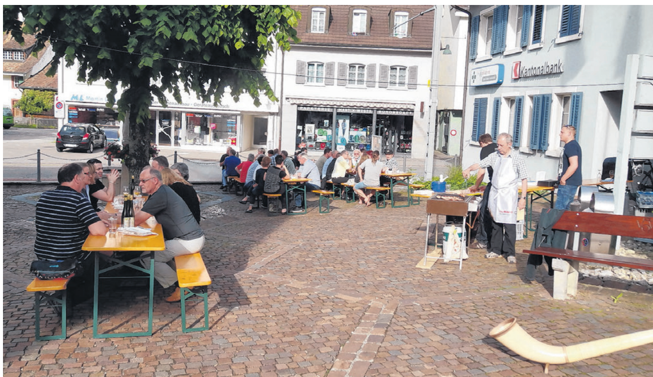
Bereits ein fester Bestandteil in der Region ist der Sommerapéro des Gewerbevereins KMU Waldenburgertal.

Oberdorf | Gemütliches Zusammensein mit dem Gewerbeverein